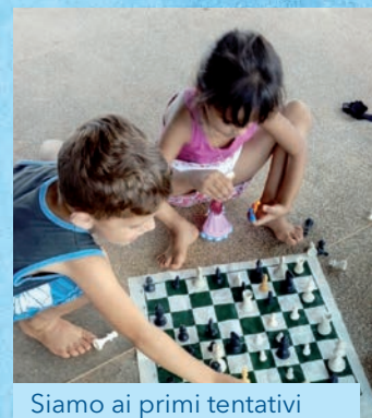
Siamo ai primi tentativi