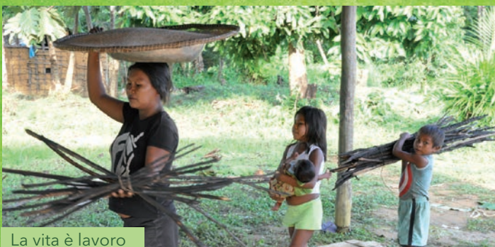
La vita è lavoro