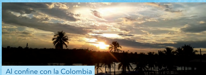
Al confine con la Colombia

La decisione di 590 benefattori ci ha consentito di ricevere 34.081,17 Euro, quale destinazione del cinque per mille delle loro imposte dell'anno 2016. Li ringraziamo di vero cuore e vi invitiamo a diffondere questa iniziativa.