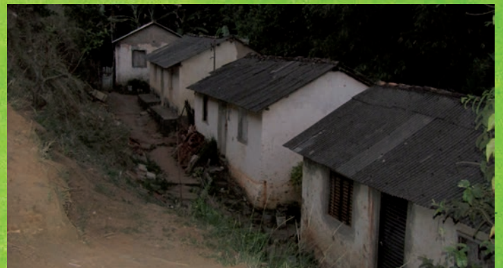
Come viveva la popolazione del bairro Alvenga a Ponte Nova, prima che il Municipio costruisse questa serie di casette a schiera, 45 metriquadri per famiglia ed un piccolo cortile. I cortili sono indispensabili, perché le stanze sono sempre molto piccole e parecchie incombenze domestiche si sbrigano nel cortile.