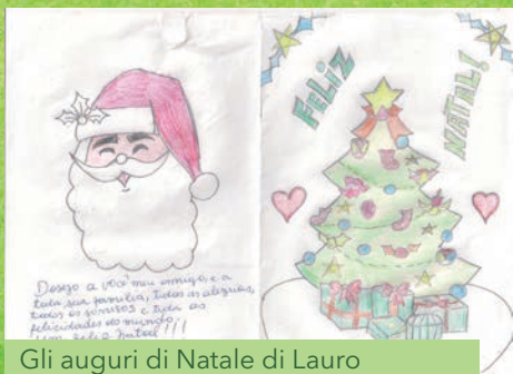
Gli auguri di Natale di Lauro

I ragazzi suonano uno strumento di bambù durante la danza del "poraquê" (pesce elettrico dei fiumi dell'Amazzonia e dell'Orinoco - anguilla elettrica - gimnoto). Lo strumento vuol ricordarne la forma.