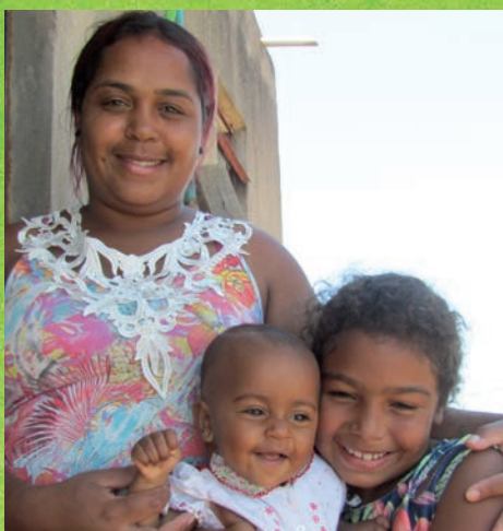
Una famigliola felice Il papà non c'è perché sta lavorando