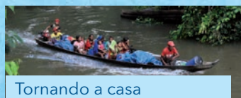
Tornando a casa