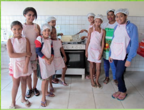
Oficina de culinária