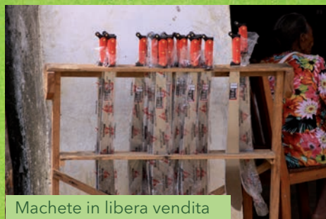
Machete in libera vendita