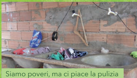
Siamo poveri, ma ci piace la pulizia