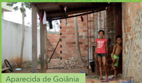
Aparecida de Goiânia