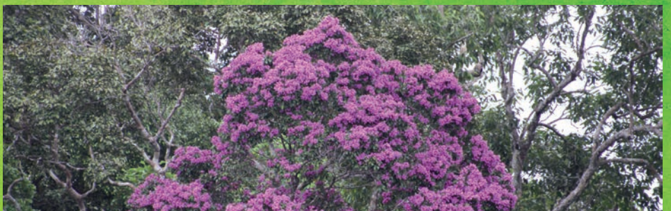
Ipé Roxo (violetto), la foresta amazzonica ne è piena e fiorisce ad ottobre, all'inizio della primavera. Il fiore della varietà gialla è, per legge, il fiore simbolo nazionale del Brasile.