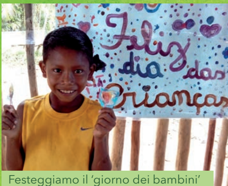
Festeggiamo il 'giorno dei bambini'