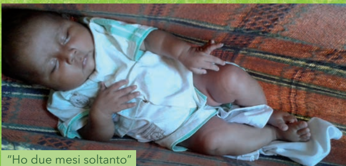
"Ho due mesi soltanto"