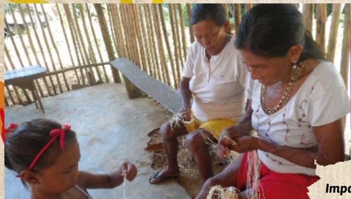
Impariamo a lavorare il "Tucum"