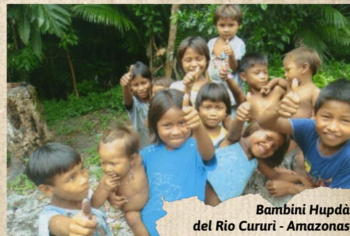
Bambini Hupdà del Rio Cururi - Amazonas