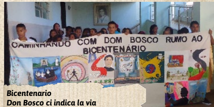
Bicentenario Don Bosco ci indica la via