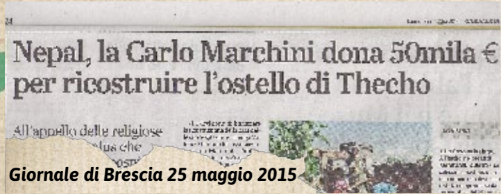
Giornale di Brescia 25 maggio 2015