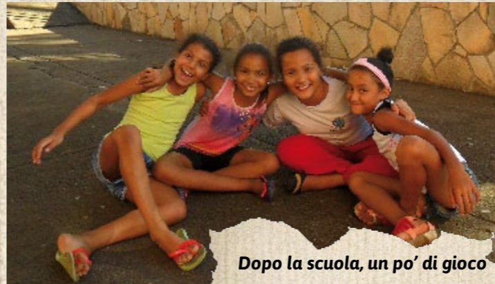
Dopo la scuola, un po' di gioco