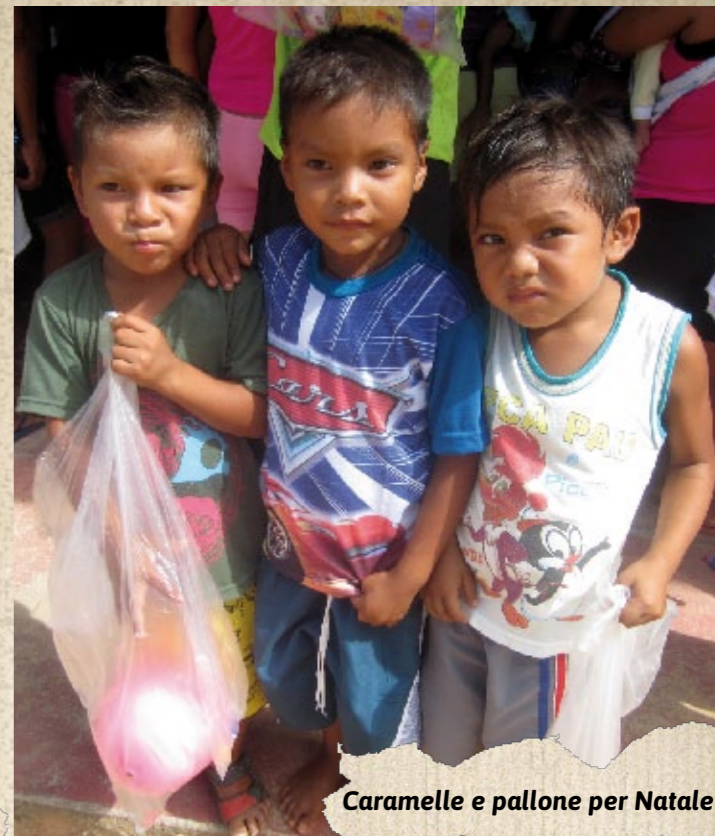
Caramelle e pallone per Natale