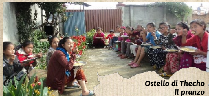
Ostello di Thecho Il pranzo