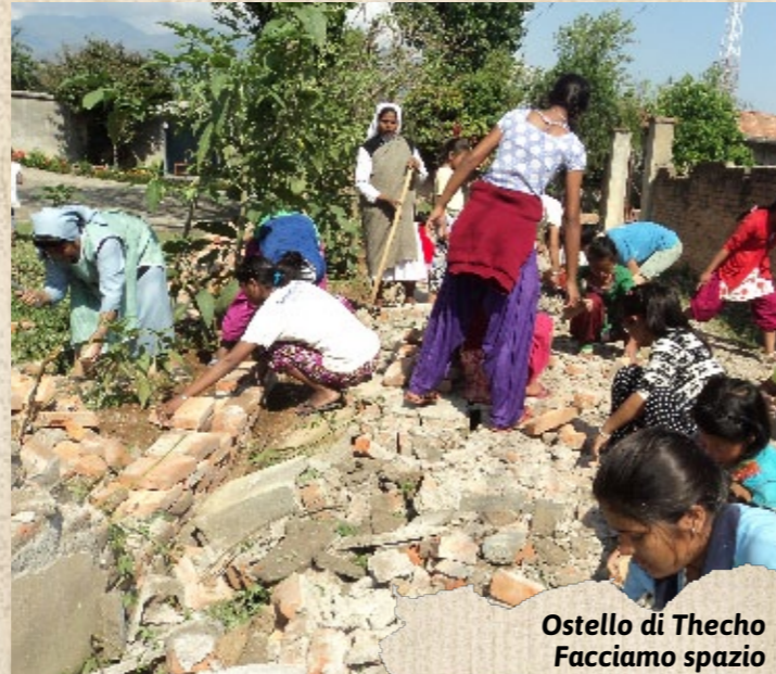
Ostello di Thecho Facciamo spazio