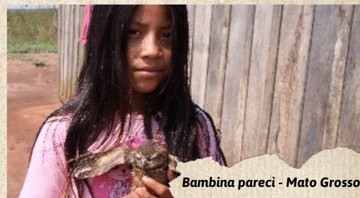
Bambina pareci - Mato Grosso