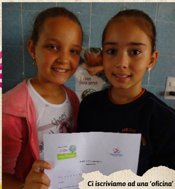
Ci iscriviamo ad una 'oficina'