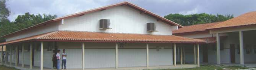
Ampliamento del Centro Giovanile Padre Giovanni Pini di Aparecida de Goiânia