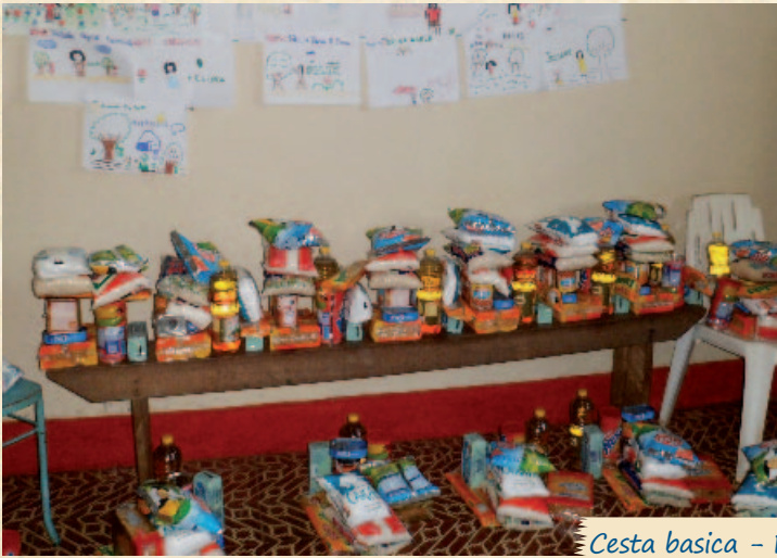
Cesta basica - Pari Cachoeira