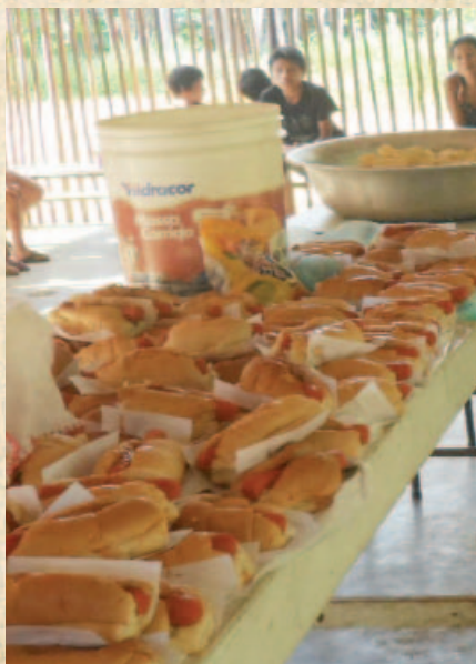
Gustosissima e abbondante merenda