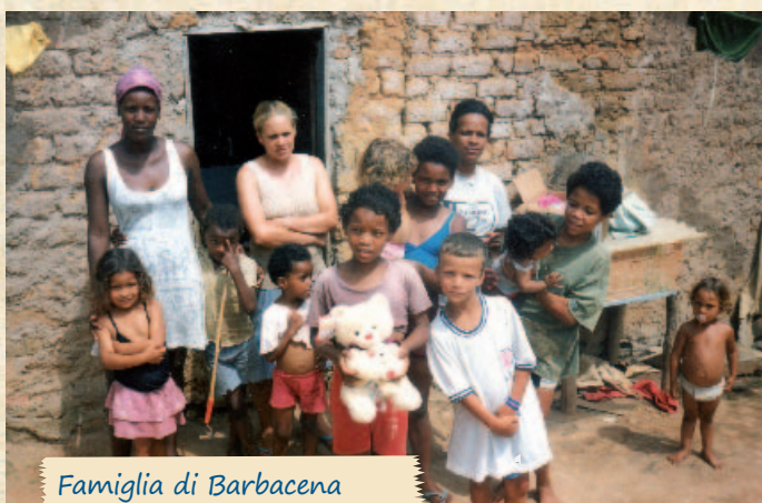
Famiglia di Barbacena