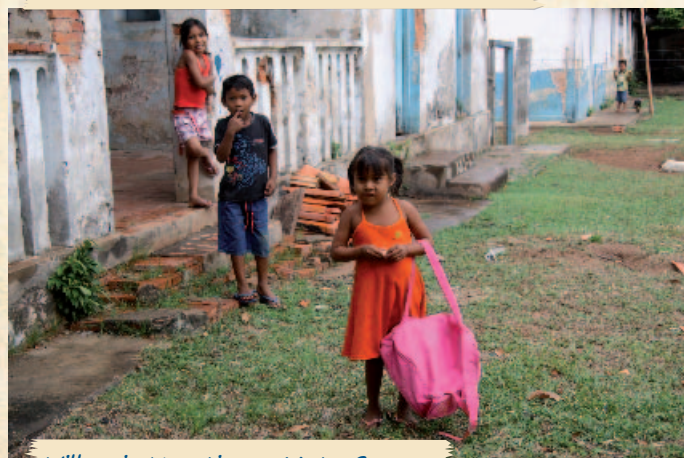
Villaggio Umutina - Mato Grosso