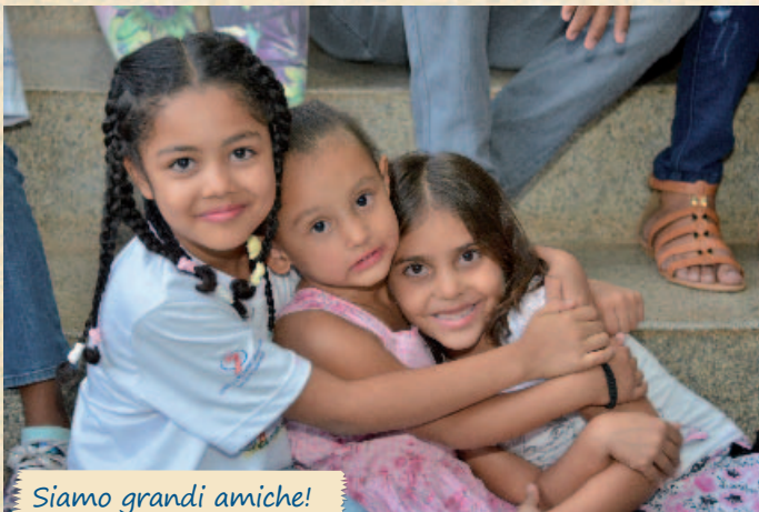
Siamo grandi amiche!