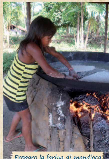
Preparo la farina di mandioca