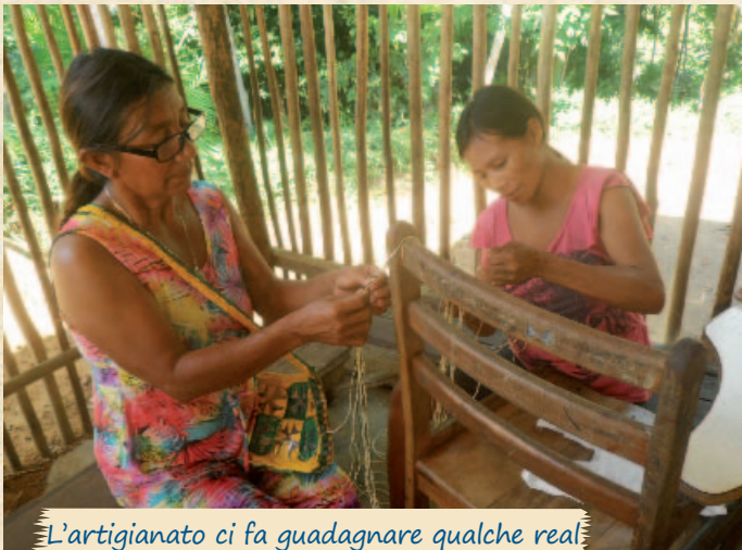
L'artigianato ci fa guadagnare qualche real