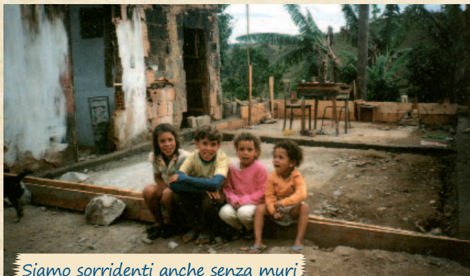
Siamo sorridenti anche senza muri