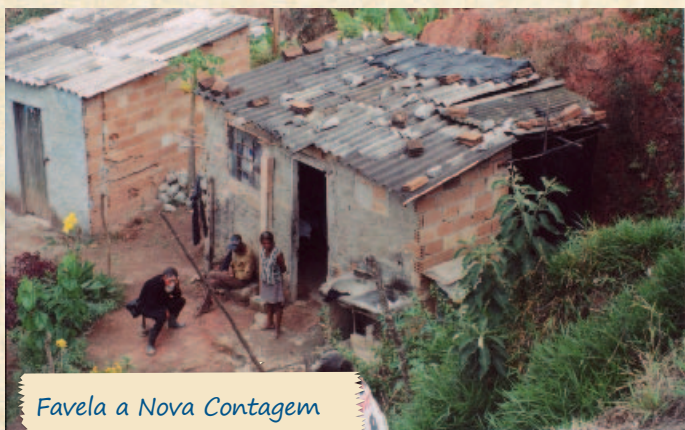
Favela a Nova Contagem