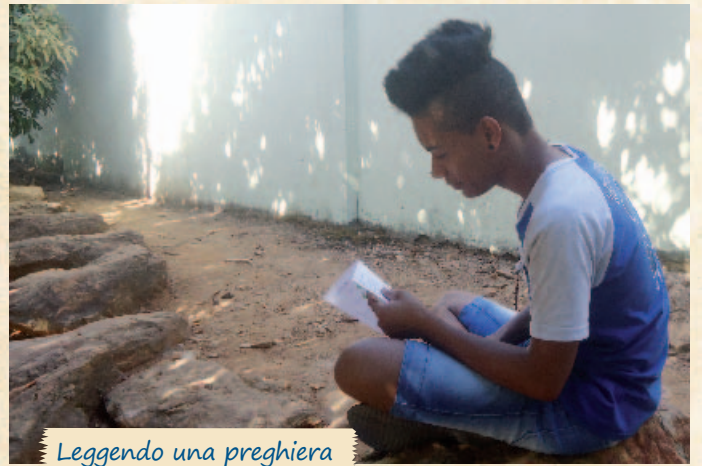
Leggendo una preghiera