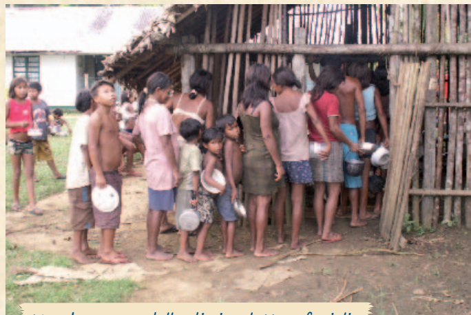
Una buona scodella di riso, latte e fagioli