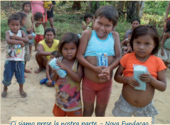
Ci siamo prese la nostra parte - Nova Fundação