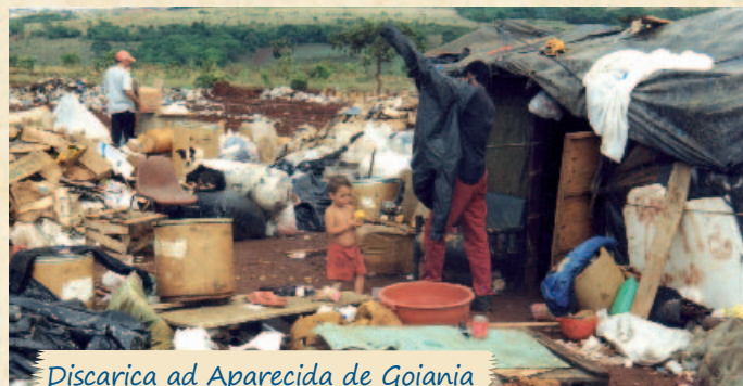
Discarica ad Aparecida de Goiania