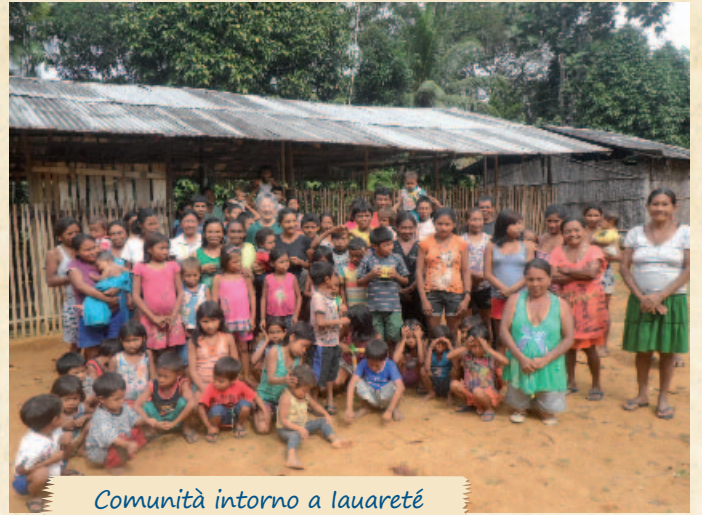
Comunità intorno a Iauareté