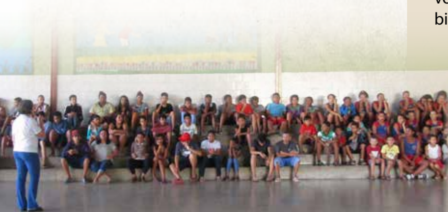
Centro giovanile Padre Pini - Riunione nella Quadra

Ringraziamo IT'S soluzioni informatiche e Comunicazione per la cortese collaborazione nella gestione del sito internet.