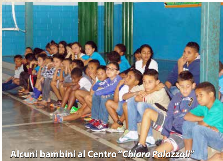
Alcuni bambini al Centro "Chiara Palazzoli"

Il 15 ottobre si è svolta la Festa dei Bambini e, come sempre, la presenza dei tanti studenti dei Centri "Pini" e "Palazzoli" ha fatto la differenza!