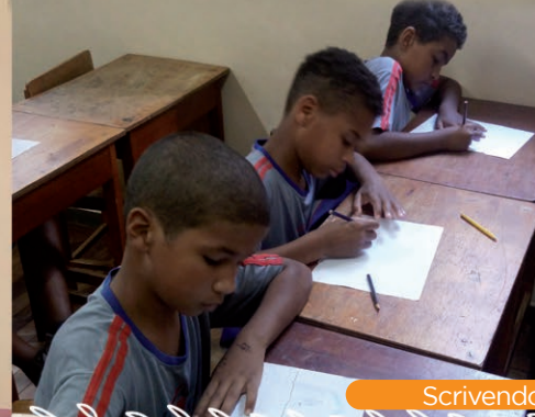
Scrivendo gli auguri