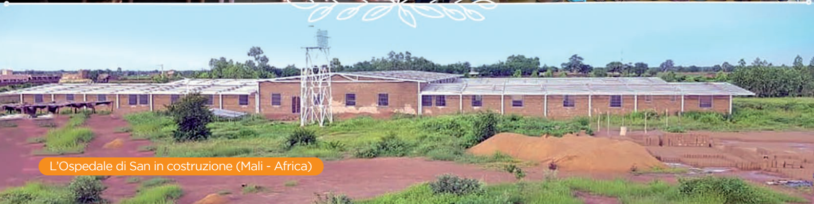
L'Ospedale di San in costruzione (Mali - Africa)