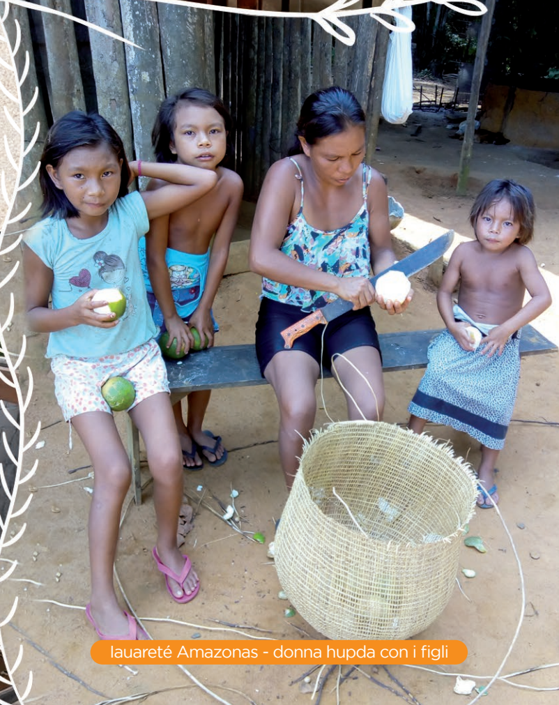
Iauareté Amazonas - donna hupda con i figli