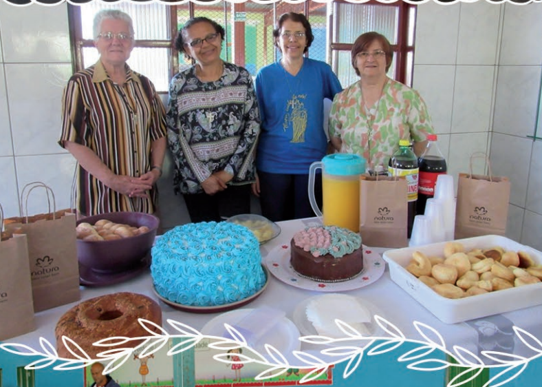
5 agosto - Apertura del secondo semestre