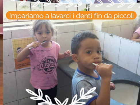
Impariamo a lavarci i denti fin da piccoli