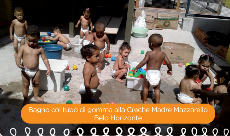
Bagno col tubo di gomma alla Creche Madre Mazzarello Belo Horizonte

Grazie ad un generosissimo aiuto, è stata portata a termine la prima fase di costruzione della quadra sportiva al Centro Giovanile Santa Mazzarello di Linhares, nello stato dello Espírito Santo. Verrà finanziata anche la seconda fase. Abbiamo più volte sottolineato l'importanza della quadra nei Centri e nelle Parrocchie, come centro di aggregazione sociale anche per le comunità e quartieri che vi gravitano attorno.