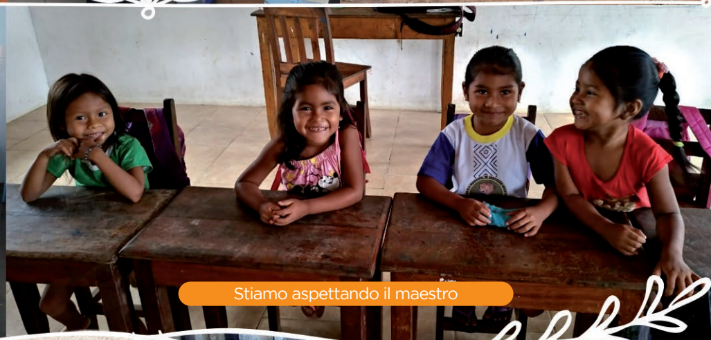
Stiamo aspettando il maestro

L'Asilo di Cachoeira da Onça (Alto Rio Negro) avrà una cucina e un refettorio, grazie anche al contributo di un nostro Benefattore.