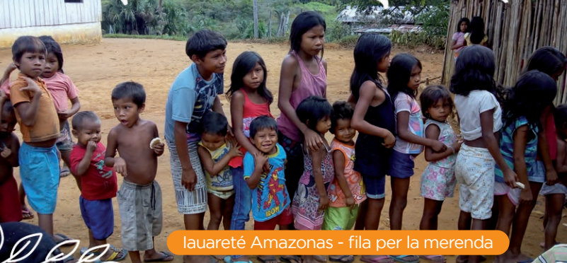
Iauareté Amazonas - fila per la merenda