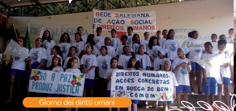
Giorno dei diritti umani