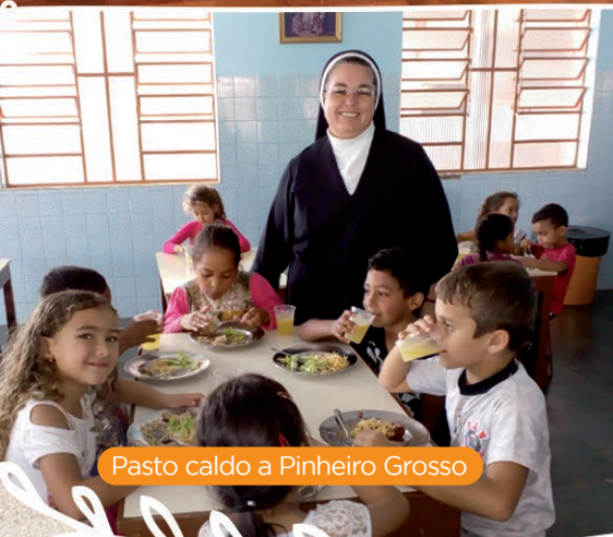
Pasto caldo a Pinheiro Grosso