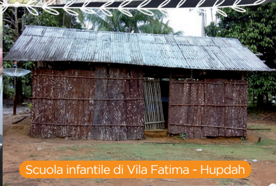
Scuola infantile di Vila Fatima - Hupdah