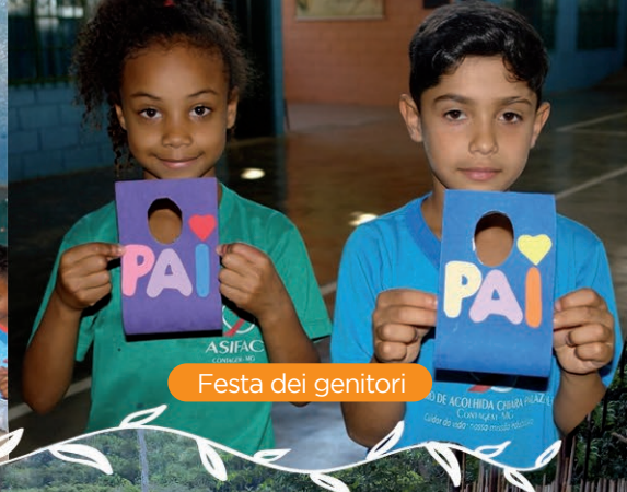
Festa dei genitori