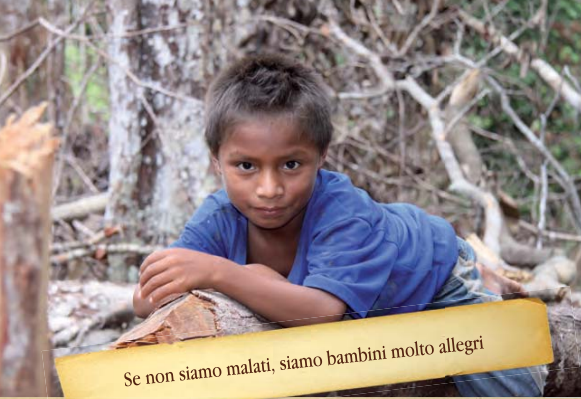
Se non siamo malati, siamo bambini molto allegri