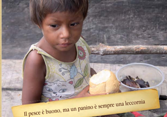
Il pesce è buono, ma un panino è sempre una leccornia

Cogliamo l'occasione per ringraziare alcuni nostri amici che in questi anni, con donazioni mirate, hanno consentito e tuttora stanno consentendo a giovani meritevoli di realizzare il loro sogno di frequentare l'Università.