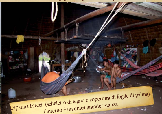
Capanna Parecis (scheletro di legno e copertura di foglie di palma). L'interno è un'unica grande "stanza"