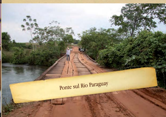
Ponte sul Rio Paraguay