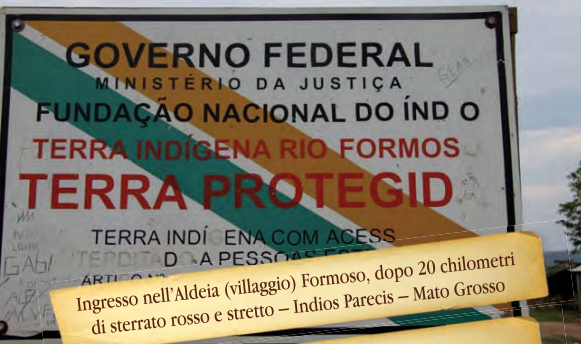
Ingresso nell'Aldeia (villaggio) Formoso, dopo 20 chilometri di sterrato rosso e stretto - Indios Parecis - Mato Grosso