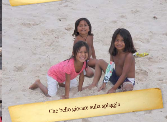
Che bello giocare sulla spiaggia