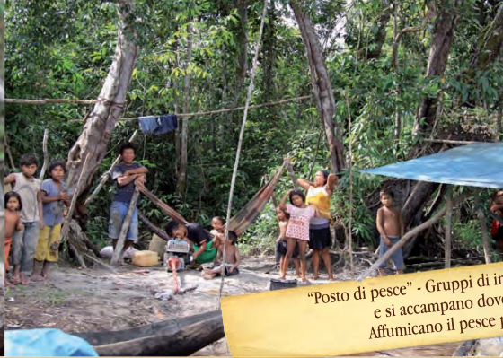
"Posto di pesce" - Gruppi di indios hupdá fanno del nomadismo e si accampano dove la pesca sembra buona. Affumicano il pesce per farlo durare nel tempo