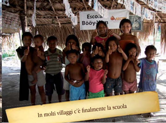
In molti villaggi c'è finalmente la scuola