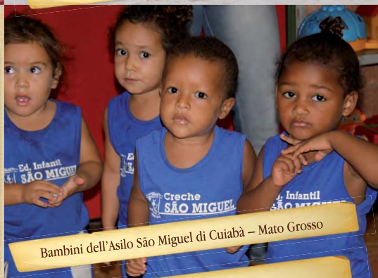
Bambini dell'Asilo São Miguel di Cuiabá - Mato Grosso