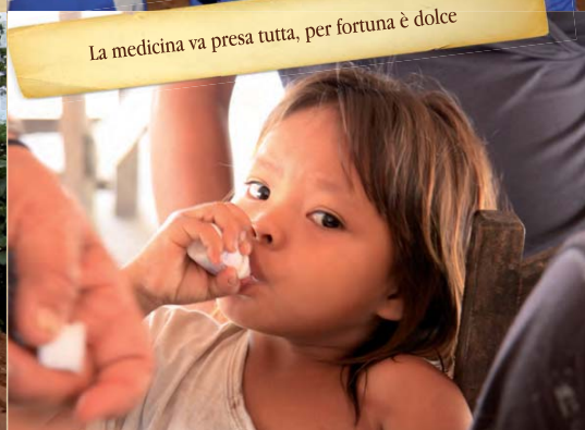
La medicina va presa tutta, per fortuna è dolce