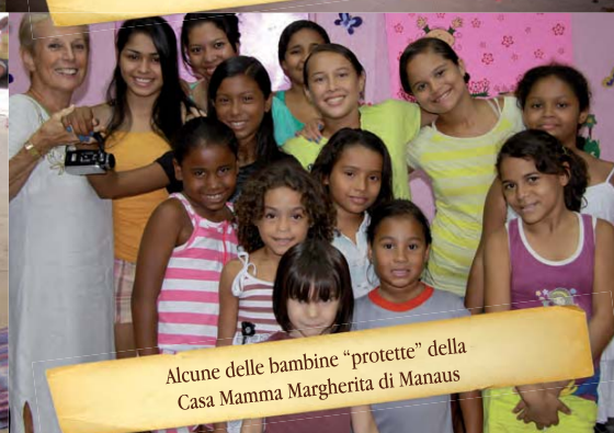
Alcune delle bambine "protette" della Casa Mamma Margherita di Manaus